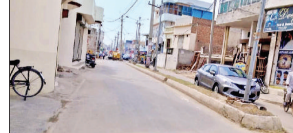
जीद। सफाई के बाद चकाचक नजर आ रहा रजबाहा रोड।