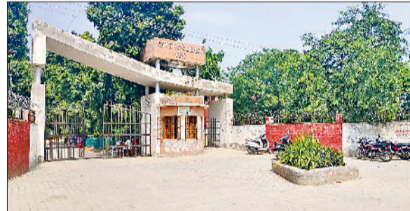
जींद। राजकीय महाविद्यालय।

जिला के चार राजकीय महाविद्यालयों को उच्चतर शिक्षा निदेशालय ने पांच नए कोर्स उपलब्ध करवाए हैं तथा बीसीए, बीए संकाय में करीब 220 सीटें बढ़ाई गई हैं। इससे विद्यार्थियों को काफी राहत मिली है। जींद के राजकीय कालेज में बीबीए का नया कोर्स शुरू हुआ। इसमें 40 सीटें स्वीकृत की हैं। राजकीय महिला कालेज में बीएएससी फिजिक्स का नया कोर्स इस बार शुरू हुआ है। जिसमें 30 सीटें स्वीकृत की गई हैं। वहीं नरवाना के राजकीय कालेज में बीए पॉलिटिकल साइंस का नया कोर्स शुरू किया गया है और इसमें 40 सीटें स्वीकृत हुई हैं। हालांकि पोस्ट ग्रेजुएशन का एकमात्र भी 40 सीटें बढ़ाई गई हैं। हायर