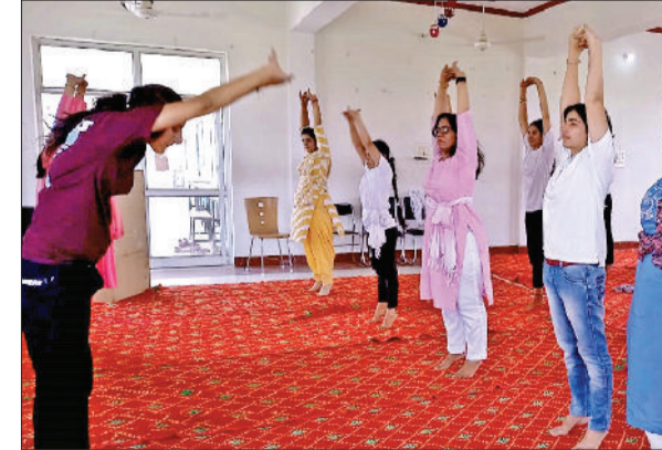
जीद। एसडी कन्या महाविद्यालय में योग करते हुए।