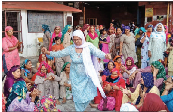
कलायत। प्राचीन श्री कपिल मुनि मंदिर में भक्ति भाव में विभोर होकर खुशी जाहिर करती महिलाएं।

इस दौरान मुख्य रूप से सरोवर में स्वच्छ जल भराव व गंदे पानी की निकासी का मुद्दा