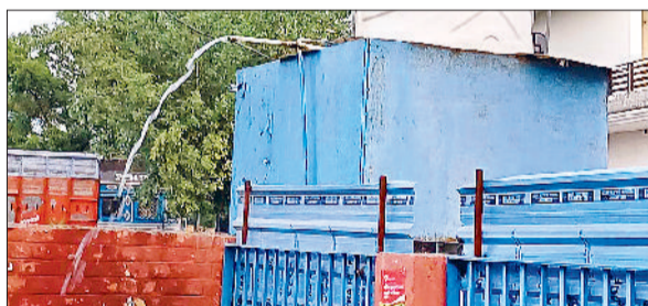
पंडरी। अनाज मंडी के गेट पर रखी टंकी से व्यर्थ बहता पानी।

करने के आदेश दिए हैं। वहीं जींद के राजकीय कालेज में बीसीए संकाय में 60 सीटें बढ़ाई गई हैं। पहले यहां 60 सीटें थी, अब 120 सीटें हो गई हैं। अलेवा के राजकीय कालेज में 80 सीटें बढ़ाई गई हैं। अब तक अलेवा कालेज में बीए की 60 सीटों पर ही दाखिला होता था। इसके अलावा नरवाना में बीए संकाय में भी 80 सीटों को इस बार बढ़ाया गया है।