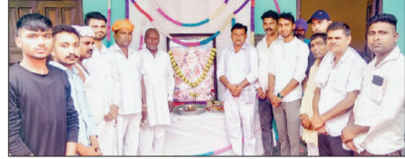
जीद। गांव बहादुरपुर में संत कबीर को नमन करते समाज के लोग।