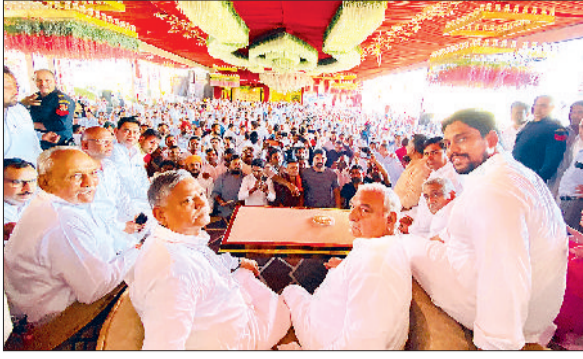
कैथल। पूर्व मुख्यमंत्री व नेता प्रतिपक्ष भूपेंद्र सिंह हुड्डा और हरियाणा कांग्रेस अध्यक्ष उदयभान कार्यकर्ताओं को संबोधित करते हुए।

बीआरपी की जानकारी 26 जून तक भिजवाने के लिए कहा गया है। गौरतलब है कि एफएलएन के तहत विद्यार्थियों को मूलभूत सारक्षरता और संख्या ज्ञान में निपुण बनाने के लिए हिंदी, गणित और अंग्रेजी विषयों में पर्याप्त शिक्षण समय मिलना आवश्यक है। इसी ध्यान में रखते हुए सभी राजकीय प्राथमिक विद्यालयों के लिए एक सामान्य समयसारणी तैयार की गई है। इस समय सारणी में दैनिक आधे घण्टे पर कक्षा एक से तीन तक 90 मिनट हिंदी के लिए, 60 मिनट गणित के लिए और 60 मिनट अंग्रेजी पढ़ाने के लिए दिए गए हैं।