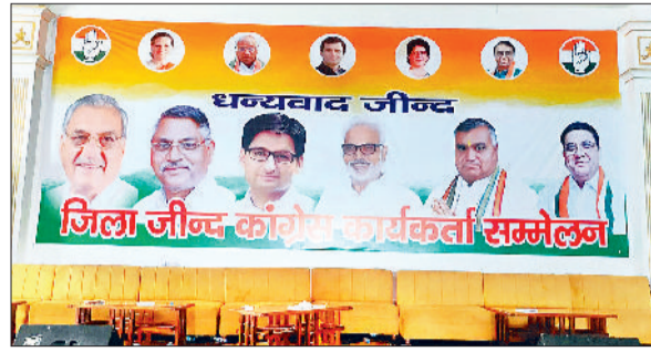
मंच पर लगा बैनर, जिस पर सांसद कुमारी शैलजा की फोटो नहीं है।