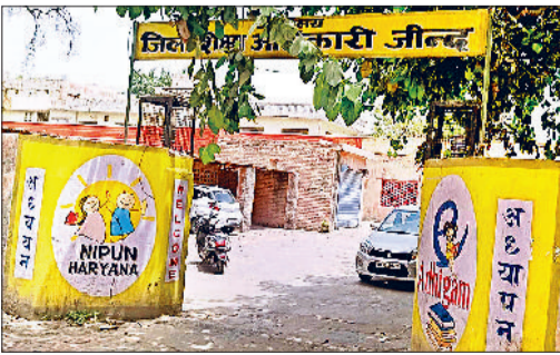
जाँद। जिला शिक्षा अधिकारी कार्यालय।

निपुण हरियाणा मिशन के तहत पिछले दिनों हुई कार्यशाला में एसआरजी (स्टेट रिसोर्स ग्रुप) केआरपी (की रिसोर्स प्रसन) व एमटी (मास्टर ट्रेनर)द्व के रूप में भाग नहीं लेने वाले एबीआरसी (असिस्टेंट ब्लॉक रिसोर्स कोऑर्डिनेटर) व बीआरपी (ब्लॉक रिसोर्स प्रसन) से हरियाणा स्कूल शिक्षा परियोजना परिषद ने स्पष्टीकरण मांगा है। 26 जून तक विभाग द्वारा दिए गए लिंक पर कार्यशाला में भाग नहीं लेने वाले एबीआरसी व बीआरपी की सूची कारण सहित भेजी जानी है।