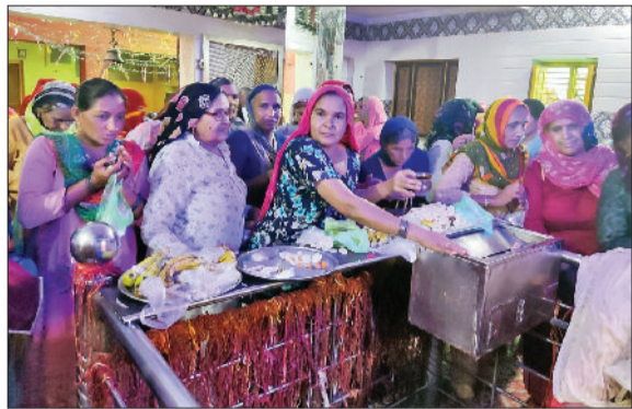
कलायत। कलायत के प्राचीन कपिल मुनि मंदिर में पूजा अर्चना करती महिलाएं।