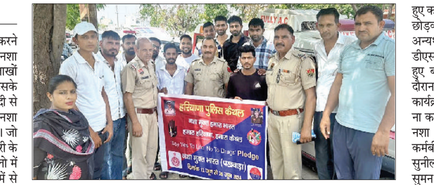
कैथल। युवाओं को नशा से दूर रहने बारे जागरूक करते पुलिस कर्मचारी।

जिला पुलिस द्वारा आमजन को नशा न करने बारे जागरूक करने के साथ साथ नशा तस्करो पर शिकंजा कसते उनकी सलाखों पीछे भेजने का काम किया जा रहा है। इसके साथ साथ न्यायालय में मामले की मुस्तैदी से पैरवी करके उचित साक्ष्य जुटाकर नशा तस्करो को सजा भी दिलावाई जा रही है। जो वर्ष 2024 दौरान न्यायालय में नशा तस्करी के 57 मामले डिमांड्ड हुए जिनमें 48 मामलों में नशा तस्करो को सजा सुनाई गई। जिनमें से एक मामले में एक आरोपी को न्यायालय द्वारा 10 साल कारावास व 1.5 लाख रुपए जुर्माने का सजायाव किया गया, जो उक्त मामले में 27 नवंबर 2020 को थाना राजौड़ पुलिस द्वारा